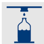
Dosagem com corte